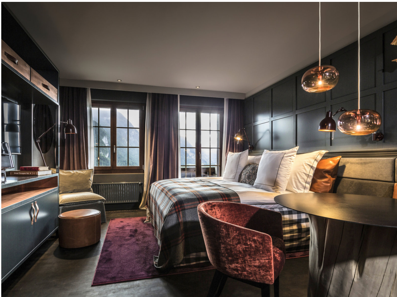
Wohnbeispiel Doppelzimmer Südseite