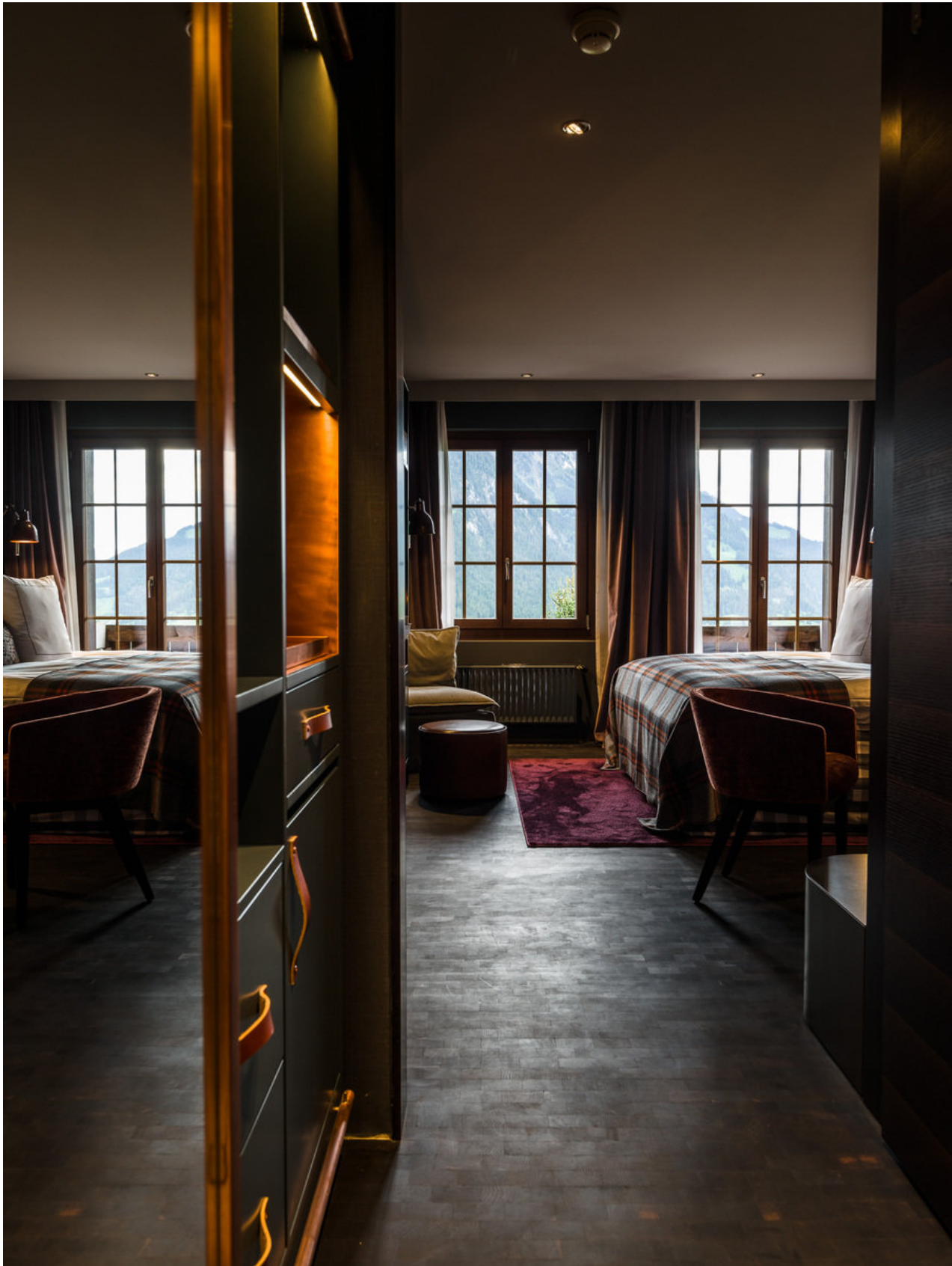
Wohnbeispiel Doppelzimmer Nordseite