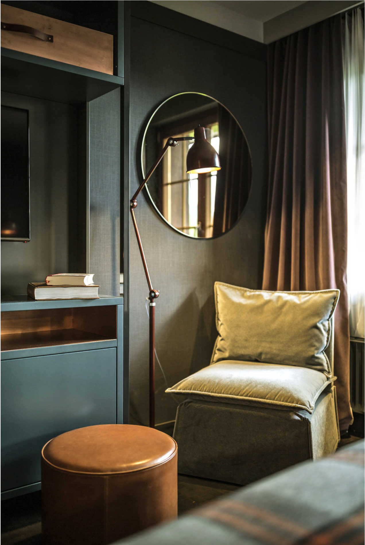
Wohnbeispiel Einzelzimmer Südseite