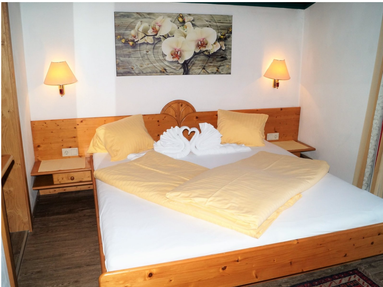
Wohnbeispiel Doppelzimmer Alpenwelt