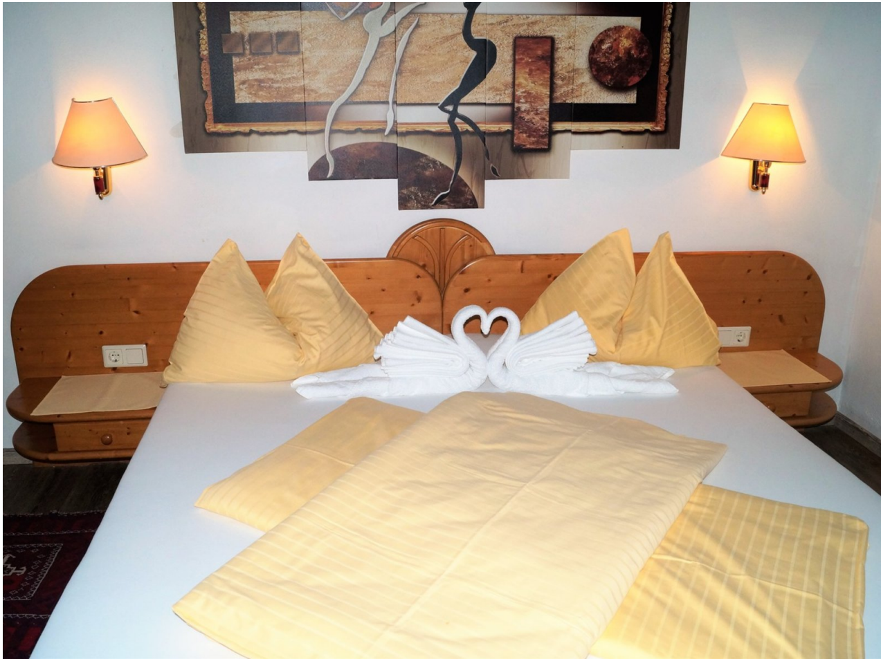
Wohnbeispiel Familienzimmer Landhaus