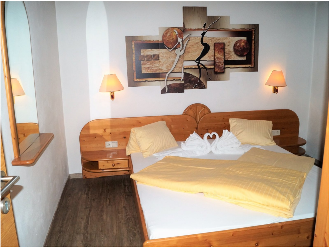
Wohnbeispiel Familienzimmer Lackenkogel