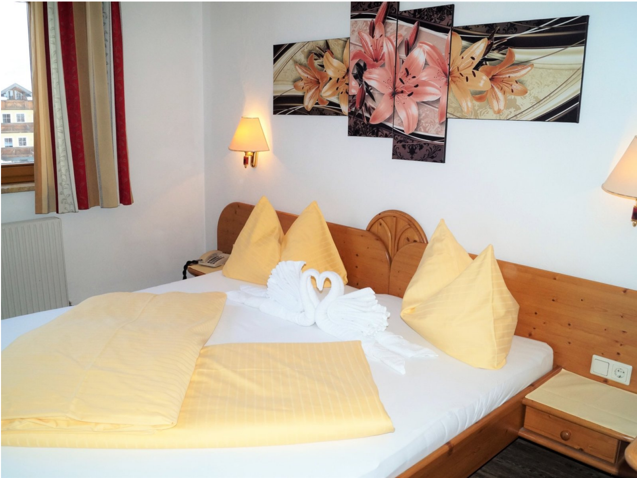
Wohnbeispiel Doppelzimmer Landhaus