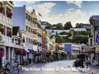
Mackinac Island

Diese Reise führt Sie zu den großartigsten Seen Nordamerikas , über die schönsten Straßen und zu einzigartigen Landschaften . Lassen Sie sich einfach mal treiben und tauchen Sie tief ein in die Schönheiten der atemberaubenden Natur!