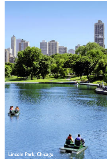
Lincoln Park, Chicago