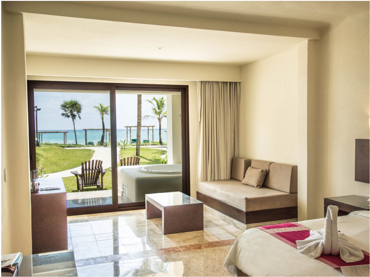
Wohnbeispiel Juniorsuite Garden View