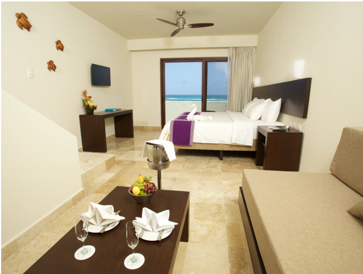
Wohnbeispiel Juniorsuite Roof Ocean Front