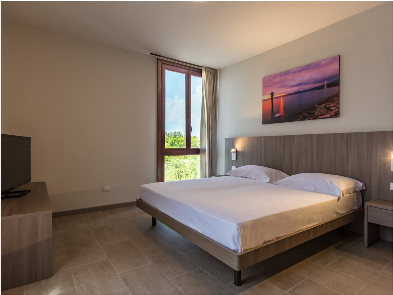
Wohnbeispiel Family Suite