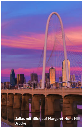
Dallas mit Blick auf Margaret Hunt Hill Brücke

Entdecken Sie den „Lone Star State“ und erleben Sie ein einzigartiges Abenteuer. Abwechslungsreiche Natur , unterschiedliche Kulturen, Strände an der Golfküste , beeindruckende Städte und Wild West Feeling pur. Texas bietet eine großartige Vielfalt an!