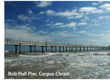
Bob Hall Pier, Corpus Christi