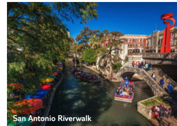
San Antonio Riverwalk